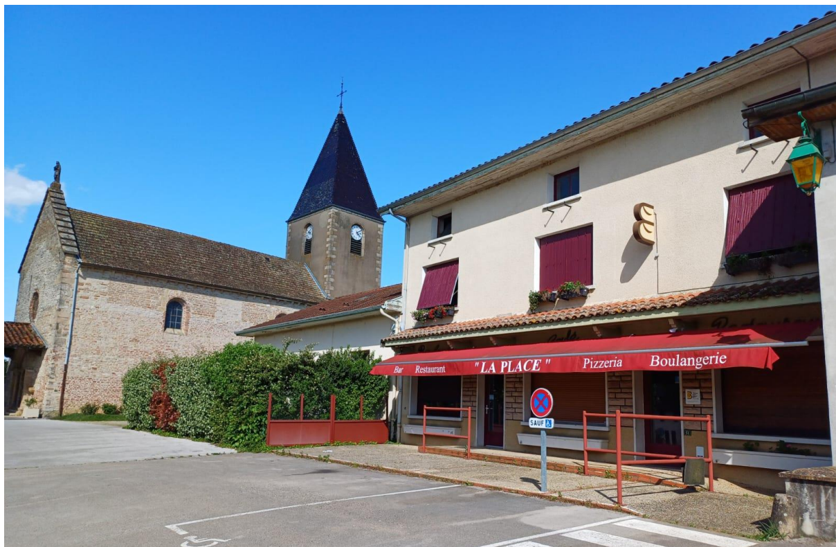
Façade du commerce