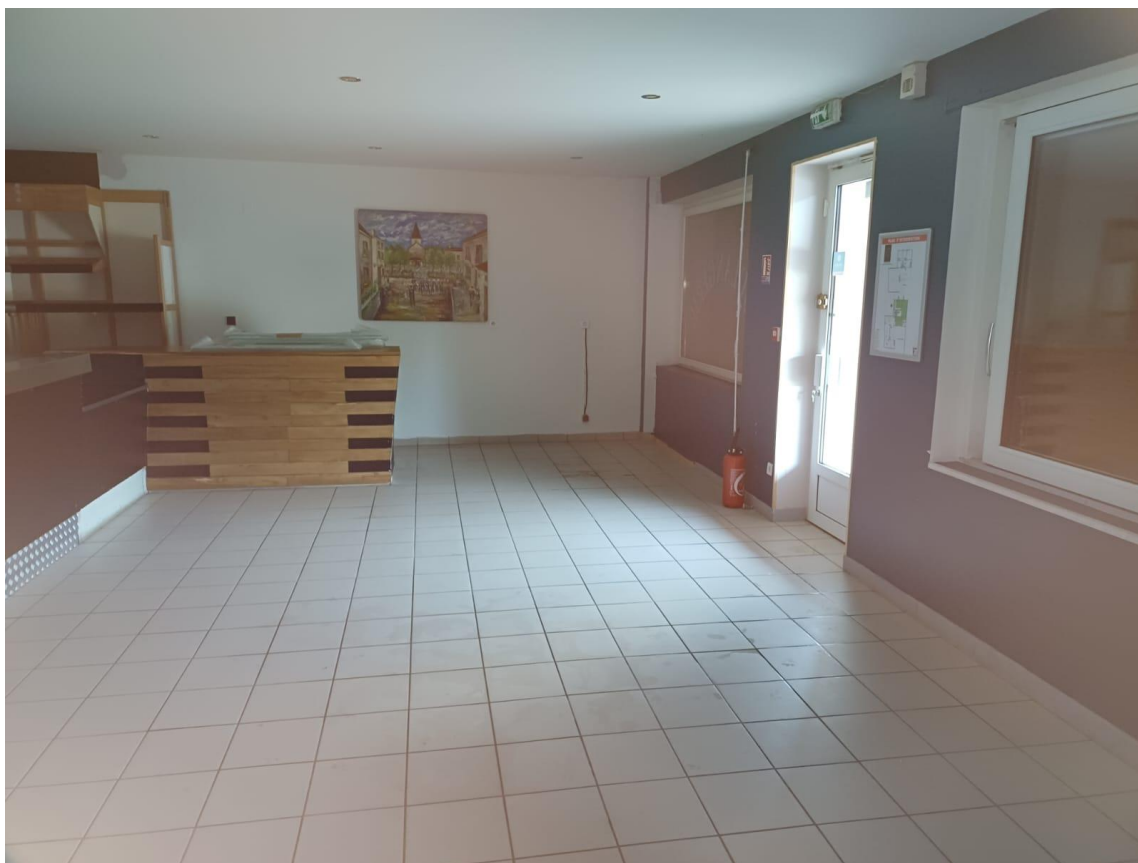
Vue intérieure côté bar