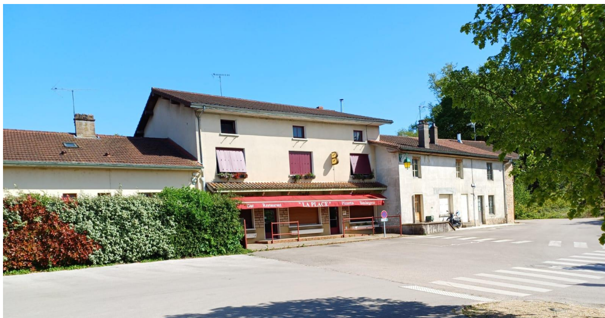
Parking et terrasse du commerce