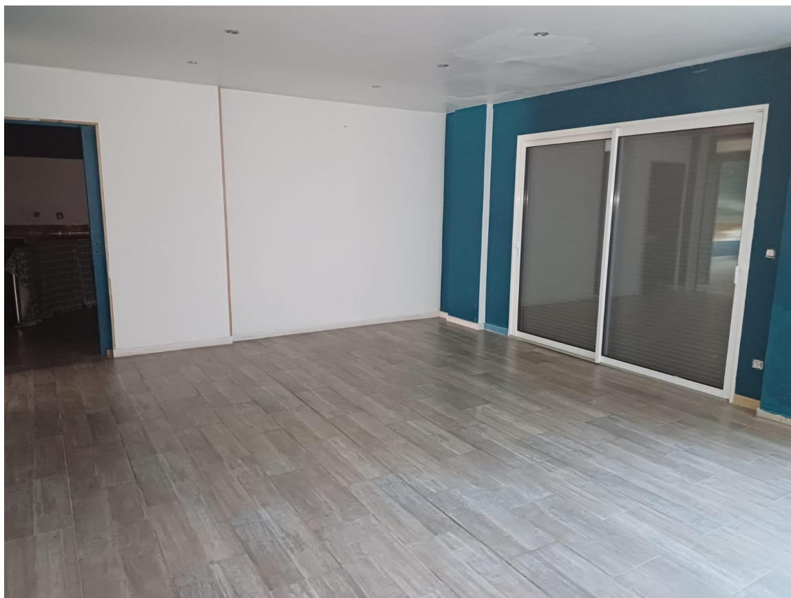
2ème salle au fond du restaurant