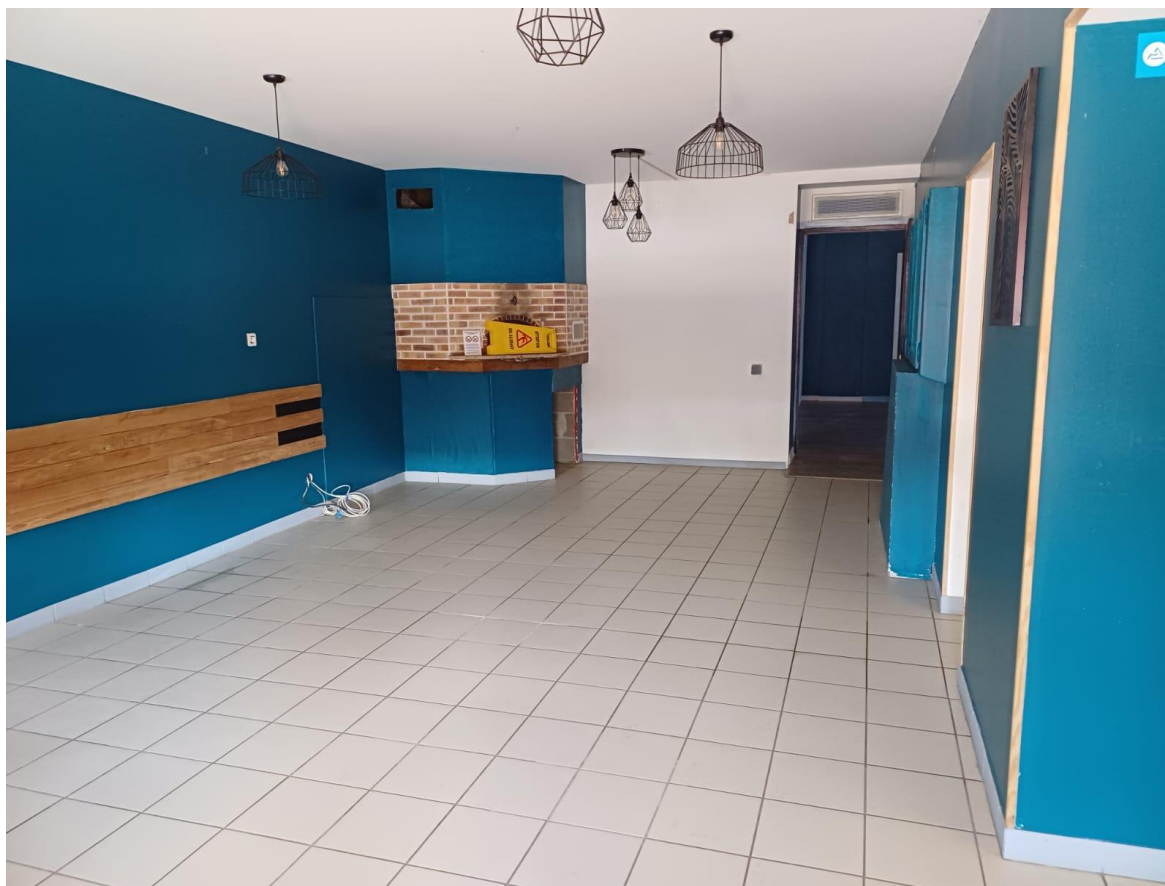
Vue intérieure côté salle de restaurant